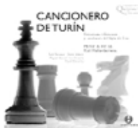
CANCIONERO DE TURÍN Romances y Villancicos del Siglo de Oro MUSICA FICTA Raúl Mallavibarrena