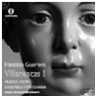
FRANCISCO GUERRERO Villanescas I MUSICA FICTA ENSEMBLE FONTEGARA Raúl Mallavibarrena