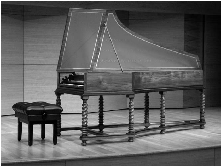
Clave C. Labrèche, Carpentras, (c. 1680), copia de Joop Klinkhamer, Amsterdam 2008. A=415, Werckmeister III