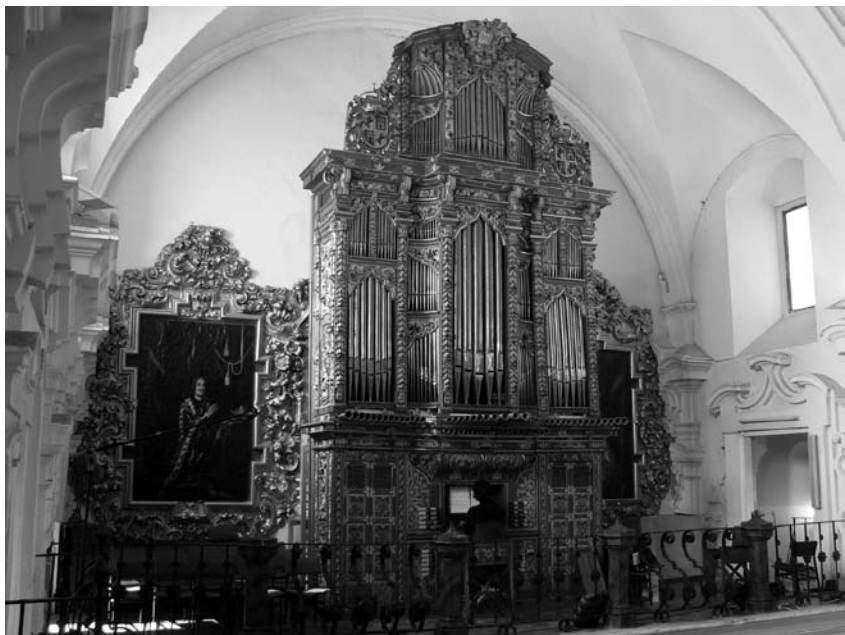
Órgano Joseph Corchado, 1735. Iglesia de San Hipólito (Córdoba), A=415, Mesotónico modificado