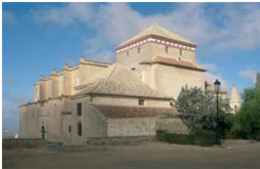
Colegiata de Osuna

Moi qui suis la vie, dit le Seigneur, je ne désire pas la mort d'un pécheur mais plutôt sa conversion et sa vie.