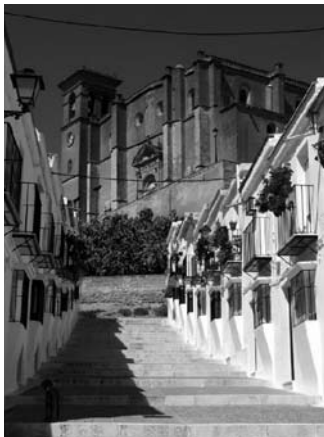
Osuna, ciudad natal de Alonso Lobo

Yo vivo, dice el Señor, y no deseo la muerte de un pecador, sino más bien que se arrepienta y viva.