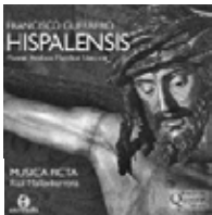
FRANCISCO GUERRERO Hispalensis MUSICA FICTA Raúl Mallavibarrena