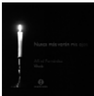
Nunca más verán mis ojos Narváez, Valderrábano, Pisador Alfred Fernández, vihuela