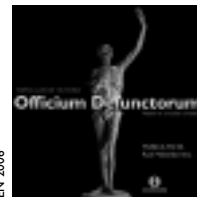
TOMÁS LUIS DE VICTORIA Officium Defunctorum Vadam et circuibō civitatem. MUSICA FICTA Raúl Mallavibarrena