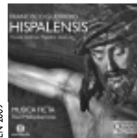
FRANCISCO GUERRERO Hispalensis MUSICA FICTA Raúl Mallavibarrena